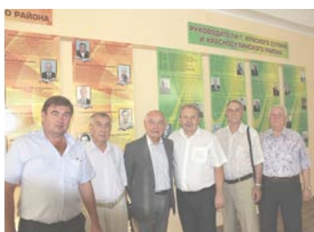
Участники форума «Имя твоё - Красный Сулин», сентябрь 2017 г.