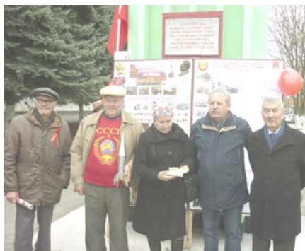
Члены правления РРИКОО «Наше наследие», 7 ноября 2017 г.