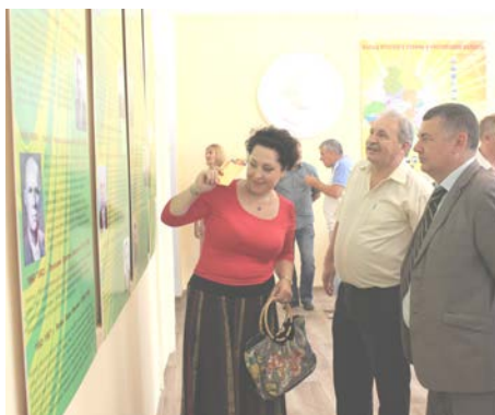
Открытие нового зала районного музея, сентябрь 2017 г.