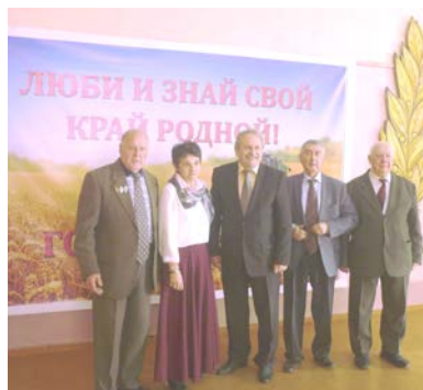
Актив РРИКОО «Наше наследие» на очередной выставке