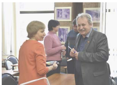
На презентации в Донской публичной библиотеке, январь 2018 г.