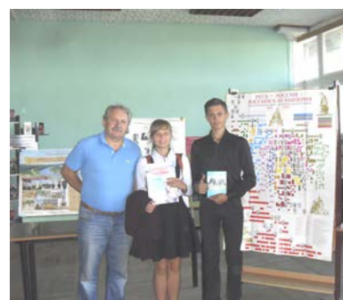
Подведение итогов и награждение молодых краеведов города, апрель 2017 г.