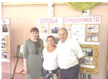
Вечер памяти Т.И. Бондаренко, июнь 2017 г.